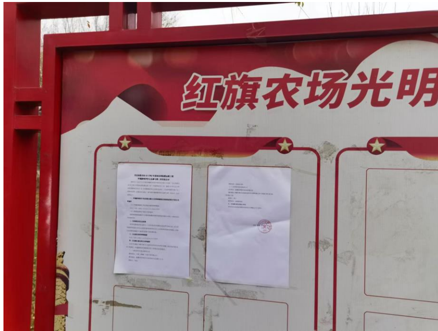
图 3-4 征求意见稿张贴公告公示截图 (a)

中国（新疆）石油工程有限公司于 2024 年 10 月 22 日在项目所在区域周边公告栏张贴了项目第二次公众参与公示信息。公示时间为 10 个工作日。张贴区域的选择符合《环境影响评价公众参与办法》要求。张贴照片见图 3-4。