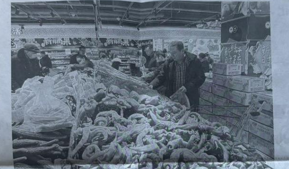
10月27日,在哈密市的一家棉库中,工人们正在对棉花进行分拣和打包。