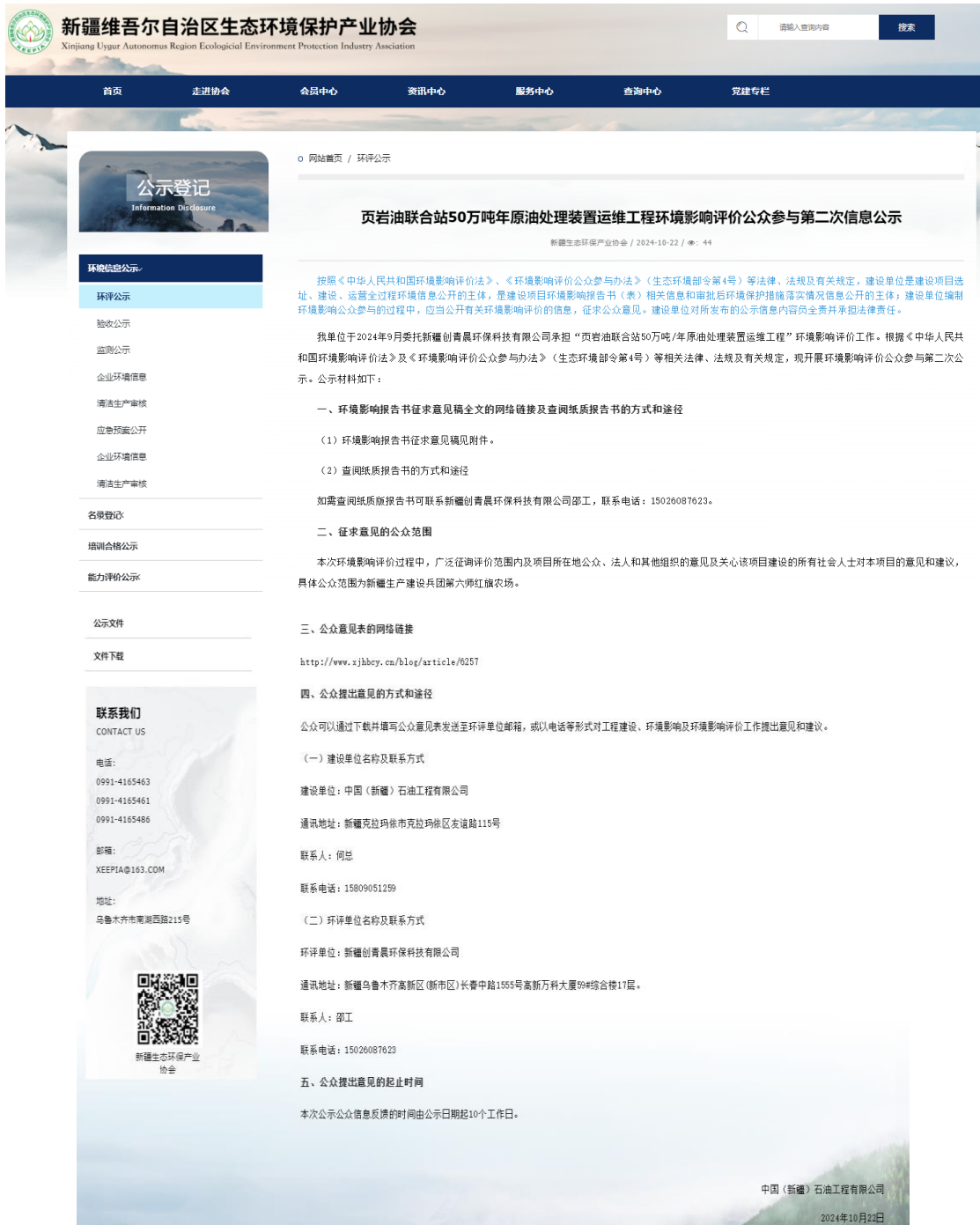
图 3-1 项目公众参与第二次信息公示截图