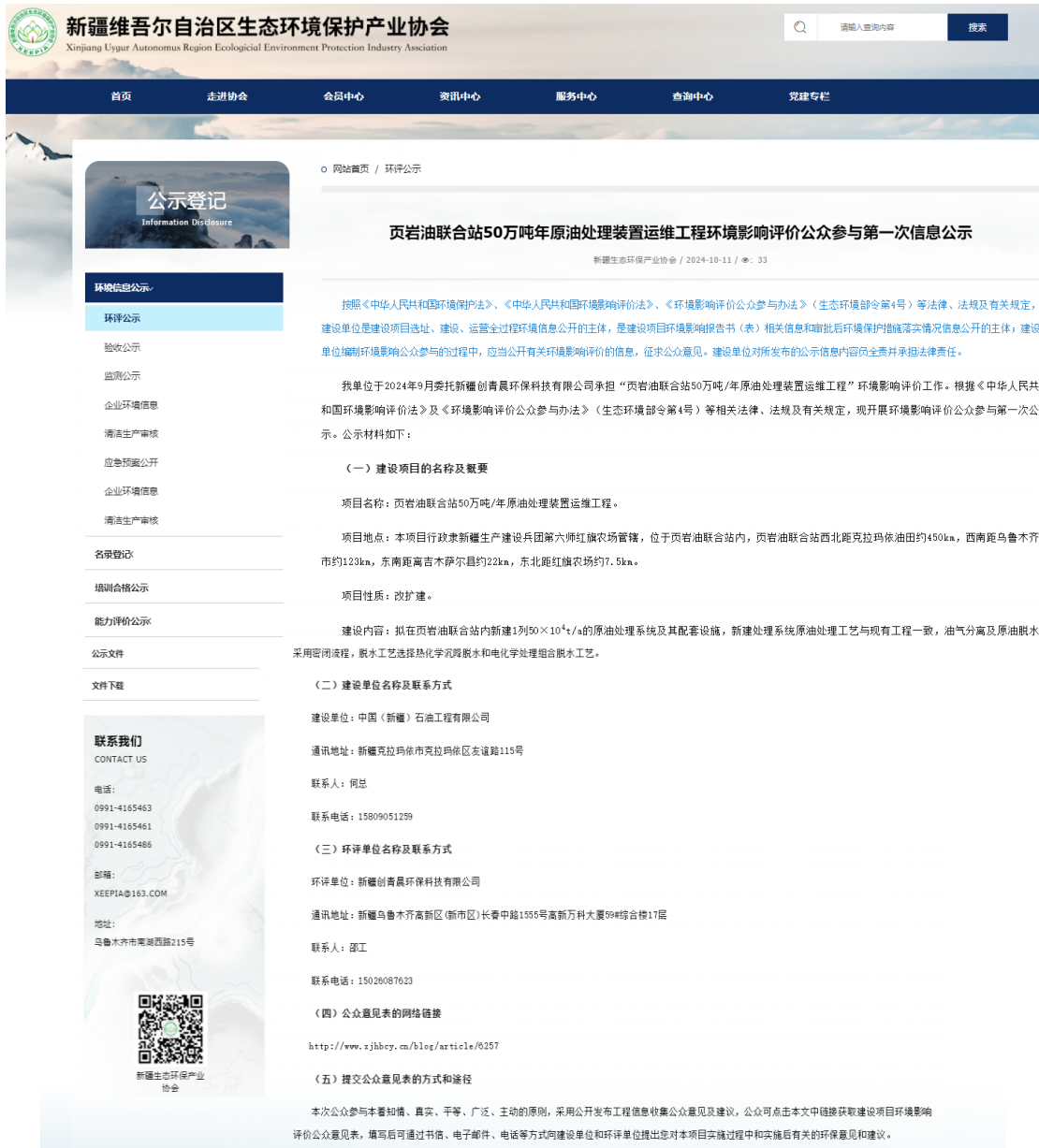
图 2-1 项目公众参与第一次信息公示截图